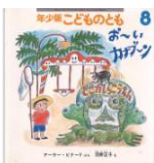
「年少版 こどものとも おーいカナブーン」 アーサー・ピナード/ぶん 沼野正子/え 福音館書店