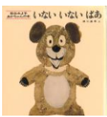
「松谷みよこ あかちやんの本 いないいないばあ」 松谷みよこ/文 瀬川康男/画 童心社

これからも、クローバー子供図書館さんにはお世話になります。どうぞよろしくお願いいたします。