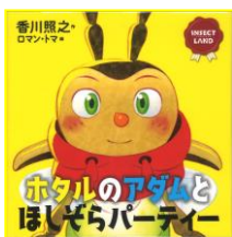
「ホタルのアダムとほしぞらパーティー」 香川照之/作 ロマン・トマ/絵 (講談社)