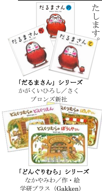
「だるまさん」シリーズ かがくいひろし/さく ブロンズ新社

この原稿を書くにあたり、今まで読んできた本や思い出、これからのことを想像しながら、やさしい気持ちで筆をとることができました。このような貴重な機会を頂戴したことに心から感謝いたします。